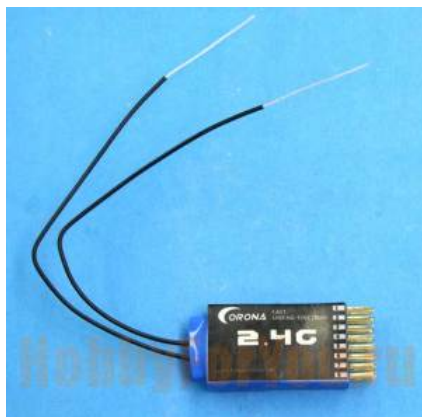
Nº: 398 – Receptor de 2,4 Ghz