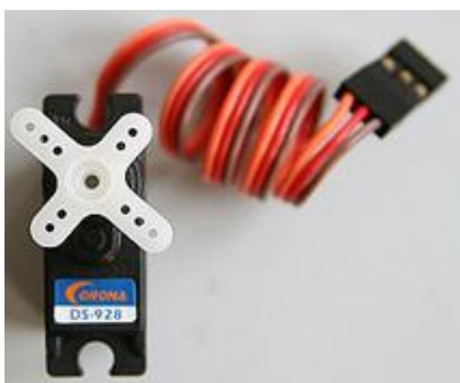
Nº: 394 – DS928 (Piñonería de plástico) Peso: 9 gr. Torque: 1,8 Kg.