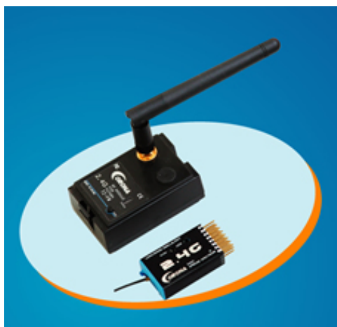
Nº: 1.260 – Módulo + Receptor