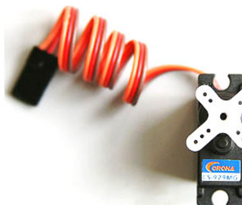
Nº: 1.202 – CS929MG (Piñonería METALICA) Peso: 13,6 gr. Torque: 1,8 Kg.